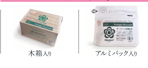
木箱入り | アルミパック入り