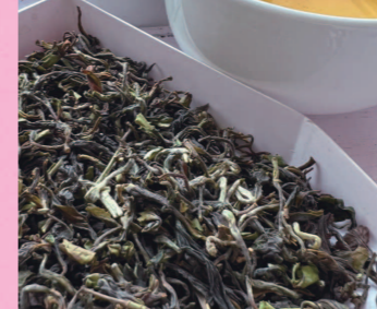
茶摘み日: 2024年4月9日(満月日) グレード: FTGFOP-1S (最高級)

「DJ」とは「ダーズリンティー」、「1」とはその年度のロット番号を示します。「DJ-1」は、「その年度、マカイバリ茶園で最初に出荷された茶葉」という意味です。緑のの良い紅茶として世界中で珍重される中、特別に日本向けに送ってくれるスペシャルな初摘み紅茶です。2024年初摘みDJ-1は、雑味のない透明感の中に力強さがあり、ハーブを思わせるグリニッシュな春らしい爽やかさがあります。美しい燃りがはいた見た目美しい茶葉です。茶摘み日は今年4月9日でした。