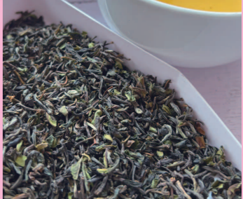
茶摘み時期: 2024年4月 グレード: FTGFOP (高級)

毎日飲んでいただきたいスタンダードな紅茶です。シルバーティップス、ヴァンテージが、広い茶園の特別な区画(日照条件、茶樹、土の状態などが優れている)でつくられるのに対して、それ以外の茶畑でつくられた紅茶の中で一番良いグレードをマカイバリ茶園ではクラシックと名付けています。クラシックは味と香りがはっきりとしています。毎日たくさん飲まれる方におすすめしている紅茶です。2024年摘みは春らしいグリニッシュな色と爽やかな味の中に力強さが加わっています。