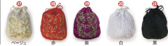
ベージュ | 赤 | 紫 | 白 | 黒 | ブルー