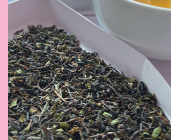
茶摘み時期: 2024年4月 グレード: FTGFOP-1S (最高級)

初摘みDJ-1の数日後に摘まれたのがヴァンテージです。季節の違いが一番わかるグレードです。味に深みが増し、グリニッシュでコクのあるフルボディです。雑味が少なく、春らしい華やかな香りと余韻にアフリコットのような酸味と甘みが残ります。マカイバリ茶園のファーストフラッシュの製茶方法は、発酵時間を短くします。そのことで、茶葉に輝く緑色の葉を残し、清涼感あふれる若々しい味と香りに仕上げます。