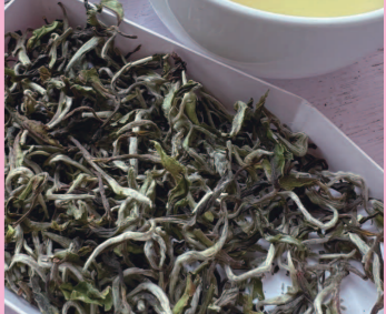
茶摘み日: 2024年4月23日(満月日) グレード: FTGFOP-1S (最高級)

マカイバリ茶園が約30年にわたって実践しているシュタイナーのバイオダイナミック農法では、満月の日、最も強いエネルギーが新芽に蓄えられると考えます。ひとつひとつ丁寧に新芽を中心に摘まれました。シルバーティップスはつくられる量が年々少なくなり、とても貴重な紅茶。マカイバリ茶園の芸術品です。茶葉も美しく、お湯を注ぐとふわっと口の中で広がるフローラルな香りは鼻腔に抜けていきます。柑橘系の香りと雑味のない透明感の中に華やかさが広がる上品な紅茶です。