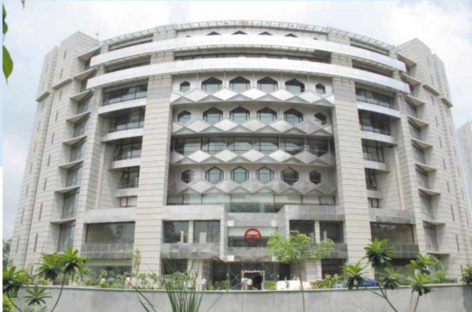
メトロの殿堂とも言うべきデリーメトロの新社屋が今年8月完成

インドの変貌は加速。鉄道王国インドに新たな勳章そしてメトロ殿堂の完成。国際公約している2010年10月英連邦競技会ニューデリー開催に向けたデリーの都市開発を始め、全国6大都市でメトロ建設計画が現在進行中である。